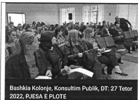
Bashkia Kolonje, Konsultim Publik, DT: 27 Tetor 2022, PJESA E PLOTE

BANORI : Ju gjate fjales tuaj permendet se ne disa fshatra do te behet e mundur te instalohet ndrcimi LED, doja te dija konkretisht se cilat fshatra perfshihen ?