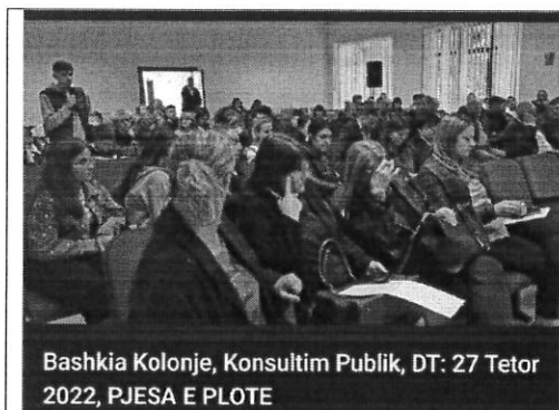
Bashkia Kolonje, Konsultim Publik, DT: 27 Tetor 2022, PJESA E PLOTE

Kleo: Une ne fakt doja te flisja per dicka tjeter, ju gjate fjales tuaj permendet realizimin e ambjenteve sportive, Pyetja ime konsiston nese gjimnazi jone perfshihet ne kete plan?