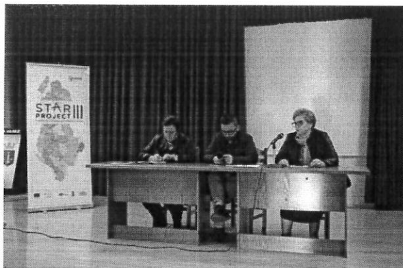
FOTO – GALERIA E KONSULTIMIT