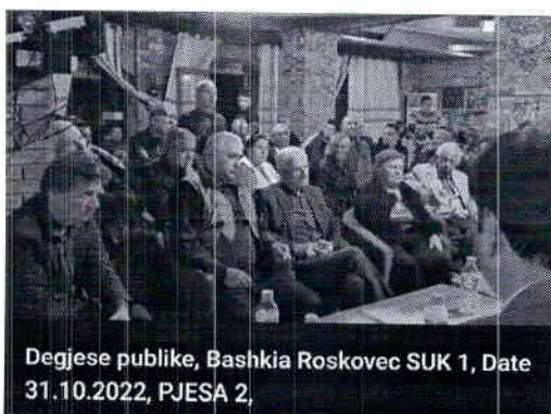
Degjese publike, Bashkia Roskovec SUK 1, Date 31.10.2022, PJESA 2,